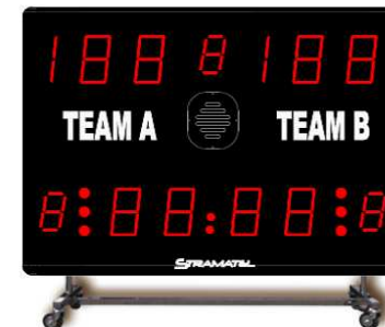
452 XME 3000_DE_B