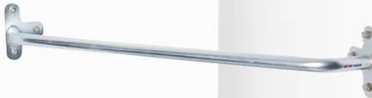
Abb. 1: Sport-Thieme Eck-Klimmzugstange

Bewahren Sie die Anleitung gut auf. Für Fragen und Wünsche stehen wir Ihnen gerne zur Verfügung.