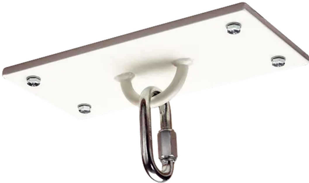
Abbildung 1: Deckenplatten-Set für Schaukelbefestigung

Bewahren Sie die Anleitung gut auf. Für Fragen und Wünsche stehen wir Ihnen gerne zur Verfügung.