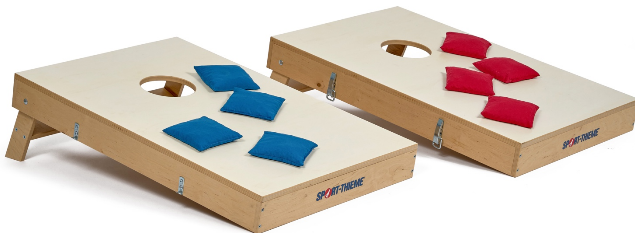
Abb. 1: Sport-Thieme Cornhole-Set „Turnier“

Bewahren Sie die Anleitung gut auf. Für Fragen und Wünsche stehen wir Ihnen gerne zur Verfügung.