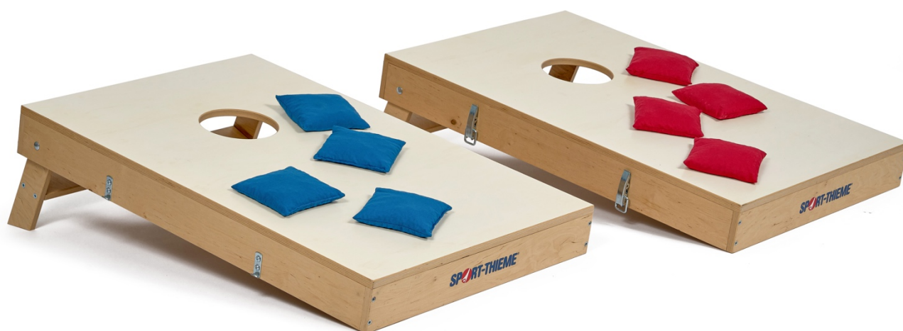
III. 1: The Cornhole Set

If you have any questions, our team is here for you.