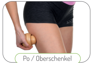
Po / Oberschenkel